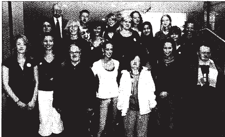
Strahlen um die Wette: Gymnasiasten und Heimbewohner